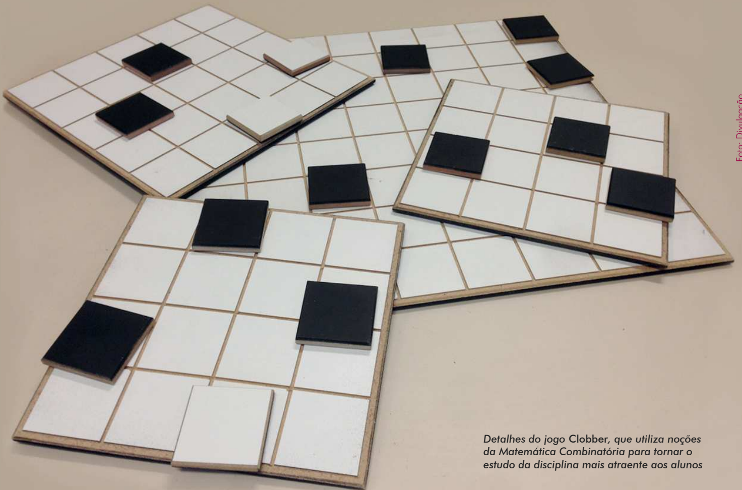
Detalhes do jogo Clobber, que utiliza noções da Matemática Combinatória para tornar o estudo da disciplina mais atraente aos alunos

A Antena Brasileira de Matemática é um núcleo de pesquisa, criado em 2008, que se integra à rede de antenas mundiais Maths à Mode-